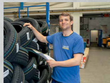
Fachlagerist / Fachkraft für Lagerlogistik (m/w/d)