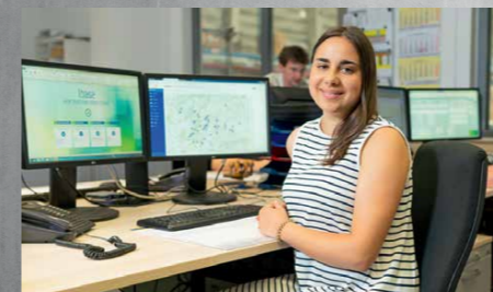
Kaufmann für Spedition und Logistikdienstleistung (m/w/d)