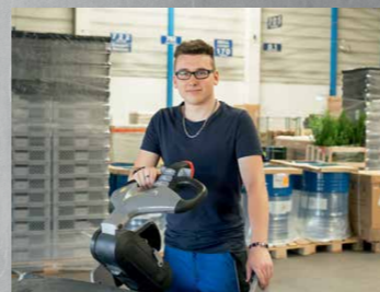
Ausbildungsmodell 2 + 2 (Fachlagerist + Berufskraftfahrer Güterverkehr) (m/w/d)