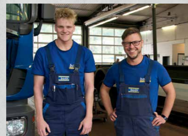
Kfz-Mechatroniker Nutzfahrzeugtechnik (m/w/d)