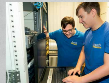
Fachinformatiker Systemintegration/ Anwendungsentwicklung (m/w/d)