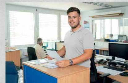
Bachelor of Arts BWL-Spedition, Transport und Logistik DHBW Lörrach (m/w/d)