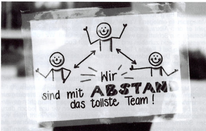
Die Regeln für geschmeidigen Umgang mit Corona hängen direkt am Schuleingang – und werden überall beherzigt